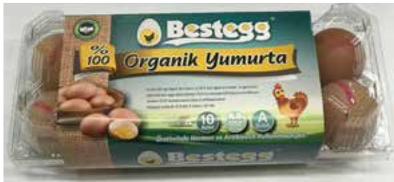
BESTEGG ORGANİK YUMURTA 10'LU