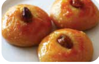
KENT ŞEKERPARE KG