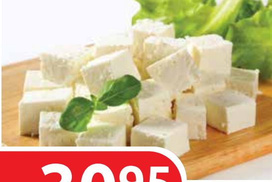
GÜRSÜT KLASİK İNEK BEYAZ PEYNİR KG