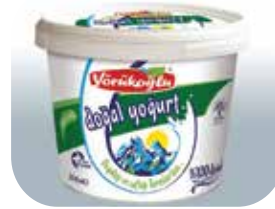
YÖRÜKOĞLU HOMOJENİZE YARIM YAĞLI YOĞURT 2000 GR