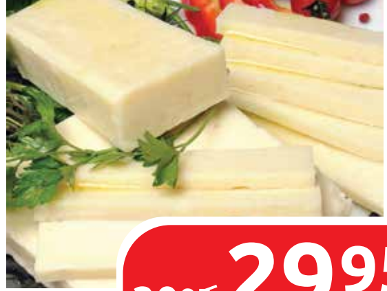
İĞDELİ KOOP İNEK TULUM PEYNİR KG