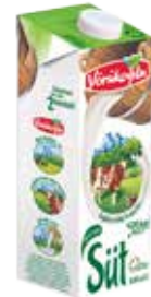
YÖRÜKOĞLU SÜT YARIM YAĞLI 1 LT