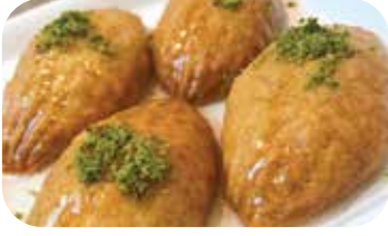
KENT KALBURABASTI KG