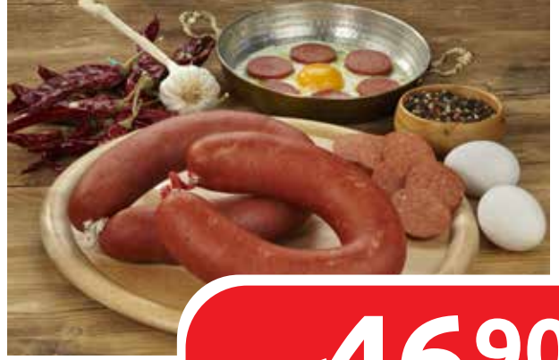
KENT KOOP SUCUK ÇEŞİTLER KG